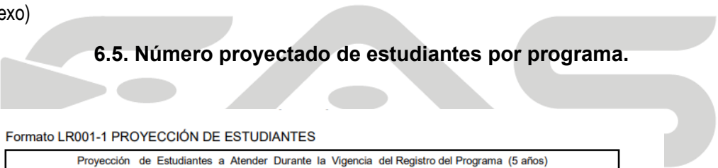
Formato LR001-1 PROYECCIÓN DE ESTUDIANTES